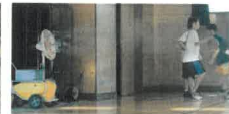
屋内(体育館)(熱暑対策)