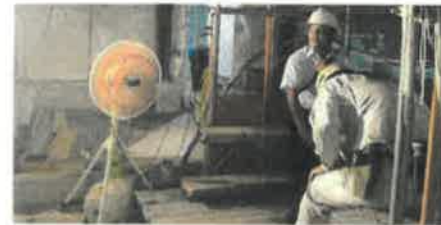
屋内(休憩所)(熱暑対策)