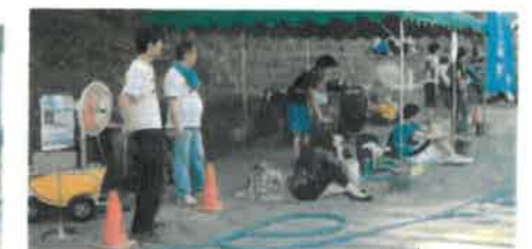
屋外(仮設テント)(熱暑対策)