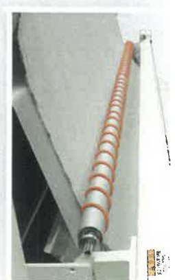
■ カットスクリュー