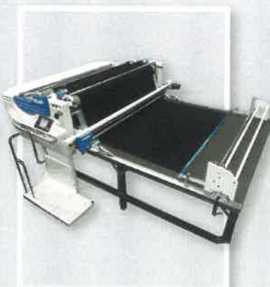
■ オペレータープラットフォーム