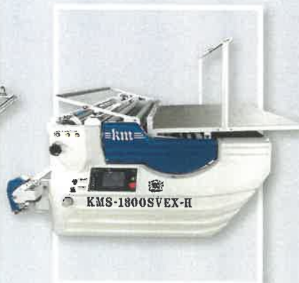
■ ヤール反テーブル