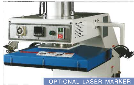
OPTIONAL LASER MARKER