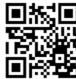
カーペット端べべラー機